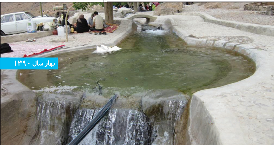
بهار سال ۱۳۹۰

چشمه زیبا و تاریخی تامهر در شهرستان تفت به دلیل خشکسالی های پی در پی در این منطقه کاملا خشک شده است.