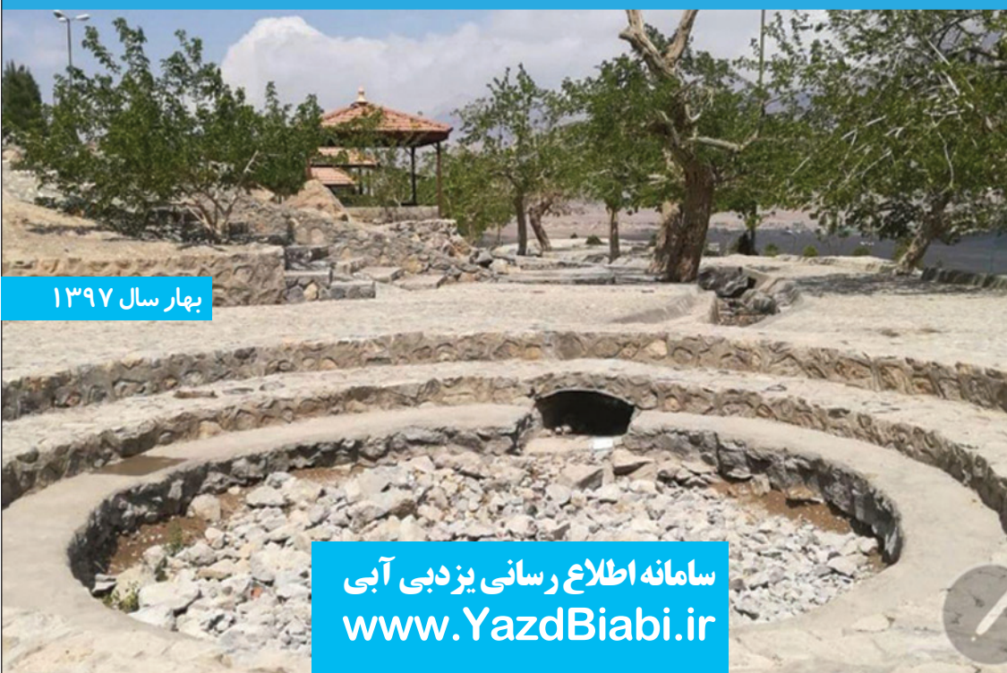
بهار سال ۱۳۹۷

آب چشمه تامهر از برف های شیرکوه تامین می شد و خشک شدن آن نشانه بسیار ناگواری است و یعنی برف مناسبی در شیرکوه برای آب چشمه وجود ندارد.