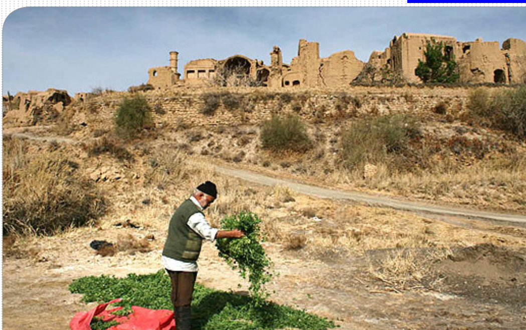
قلعه خرانق یکی از بزرگترین قلعه‌های مسکونی روستایی استان یزد و یکی از چندین قلعه‌های دارای خانه‌های دو سه و چند طبقه در جهان است و همانند نمایشگاهی است که غرفه‌های آن از خشت و گل ساخته شده‌است و قدمت آن به دوره ساسانیان بر می‌گردد.