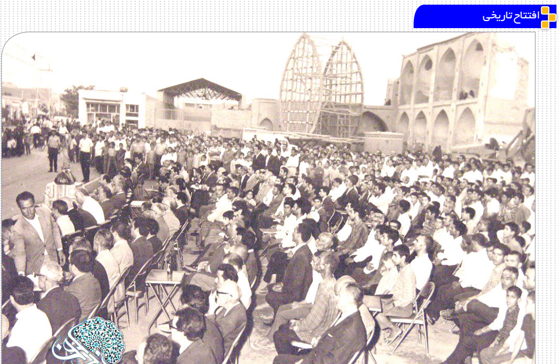
در اواخر دهه چهل در مراسمی خیابانی که امروز به نام بلوار امامزاده - حذف فصل چهارم ابر انشهر و میدان بعثت واقع است - با حضور مردم و مقامات محلی افتتاح شد.

بارش باران در هر صورت برخی از علائم خشکسالی را حتی به صورت موقت تسکین می دهد. یک مثال خوب از رابطه ی بارش باران و خشکسالی ممکن است رابطه بین دارو و بیماری باشد. یک دوز دارو