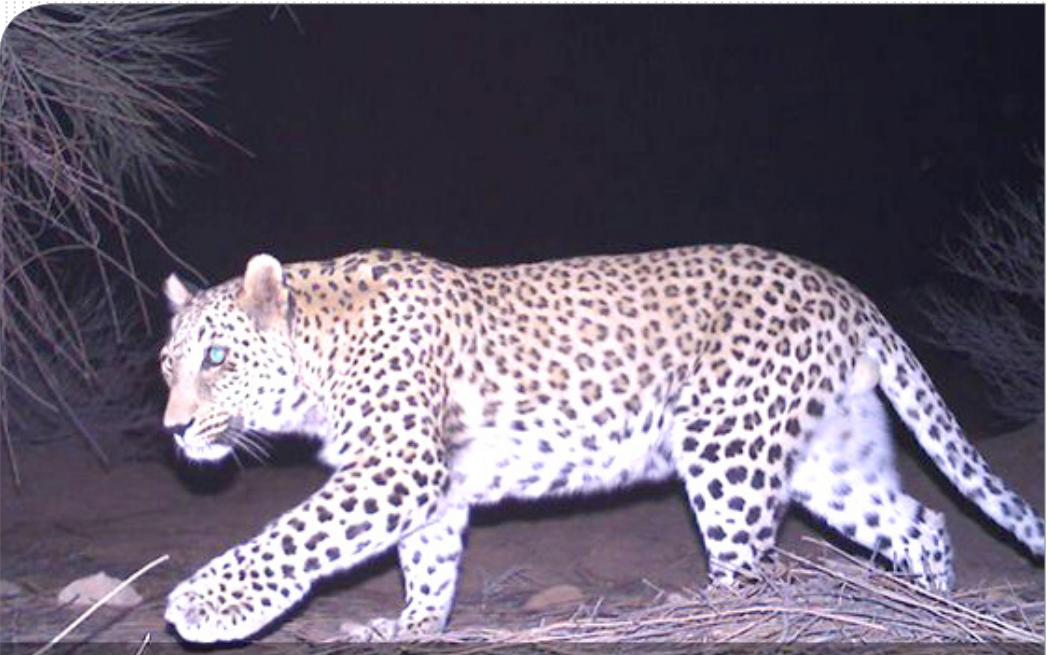
یک یوزپلنگ آسیایی عاشقی برای رسیدن به جفت ماده اش فاصله ۱۵۰ کیلومتری بین پناهگاه حیات وحش نابیندان طبس با منطقه شکار ممنوع کم کی بهاباد در گرمای ۴۵ درجه مرداد ماه این مناطق بیموده است. یوز عاشق پیشه برای بغای نسلش می جنگد.