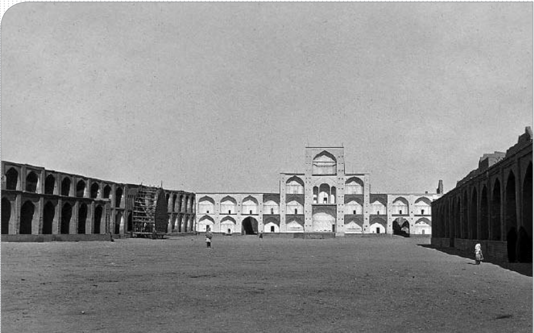
این عکس فوق ارزشمند از «میدان بعثت یزد» در حوالی سال های ۱۹۰۰ م (۱۲۸۰ ه.ش) توسط «سرترپب ژنرال سر پرسى مولزورث سايکس» نظامی، سیاستمدار و ایران پژوه نامی بریتانیایی گرفته بر روی شیشه گرفته شده و در «موزه بریتانیای» نگهداری می شود. غول آباد

هفتمین نشست شب یزد به میزبانی خانه فرهنگ صدوقی برگزار شد: